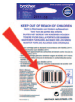
gencod des cartouches d'encre